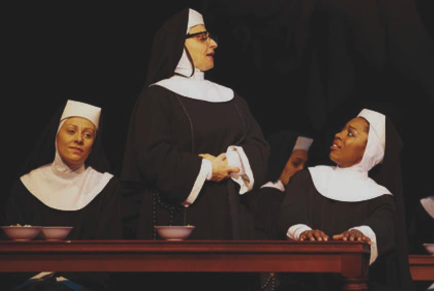
Sister Act